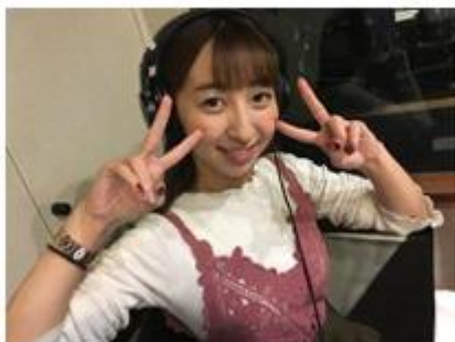
生放送中の静止画