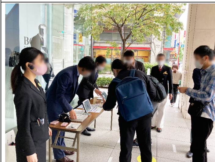
NUMBER TICKET による整理券発行の様子

松屋銀座 8F イベントスクエアで開催された「第43回世界の中古カメラ市」の入場整理券配布の様子 (10月14日)